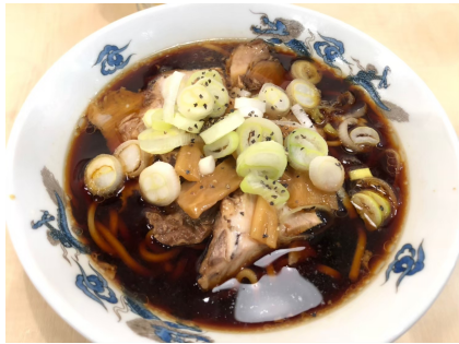
元祖ブラックラーメン