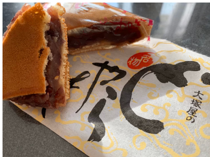
岩瀬名物 三角どら焼き

2020年3月21日に路面電車が南北開通しました。 2018年度は富山駅の南側のみを調査していましたが、 北側や南側の新たなエリアを調査しました。