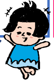
北陸電力キャラクター りこに