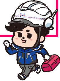
北陸電力送配電キャラクター そうた