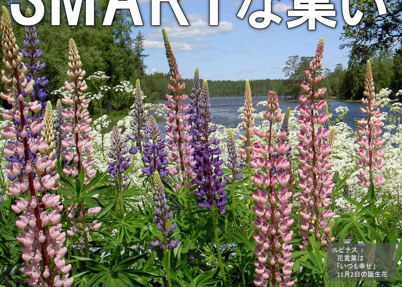
ルピナス 花言葉は「いつも幸せ」 11月2日の誕生花