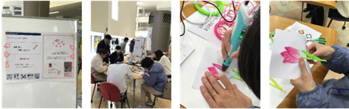
図3 ワークショップ「体験3Dペン」