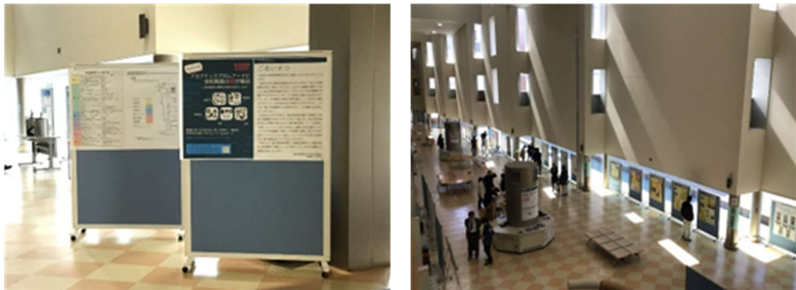
図4 展示全景(自然科学本館アカデミックプロムナード)