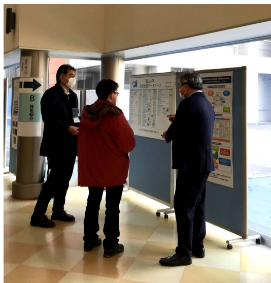
図2 本学によるパネル展示

本イベントは金沢大学総合技術部が主催し、技術職員の活動を広く学内外に発信することを目的として開催されたものであり、自然科学本館(アカデミックプロムナード)に3月9日(月)から12日(木)まで常設展示がされ、12日(木)ライブイベントとして、当日は各部門による技術紹介パネルの展示に加え、セミナーやワークショップなどが実施され、技術職員の活動を紹介する場となっていた。図2に示す本学によるパネル展示についても、金沢大学ならびに他大学の技術職員をはじめ、教職員等から質問や意見交換があり、技術支援の取組みやスキルデータベースの考え方について情報交換を行うことができた。