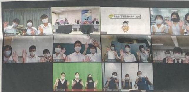
大会を終え、オンライン上で手を振り合う生徒や判事ら