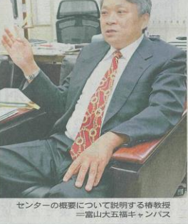
センターの概要について説明する特教授 富山大五福キャンパス

富山大は既に、CO 2 からペトトホルやポリエチレンの原料となる「ラキレン」を作る基礎技術の開発に成功している。商業生産に向け、同センターが中心となって三菱商事などと連携し、実験施設の新設や実用化への準備を進めている。CO 2 を原料に変換する技術の開発も担う。